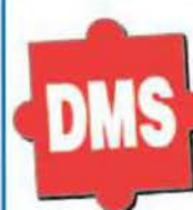
DMS Expo: Große Bühne für ECM und Output- Management